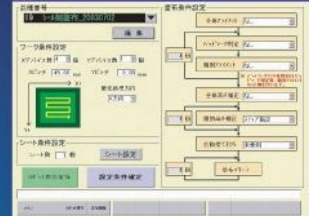
프로그램 실행 화면 Program output display