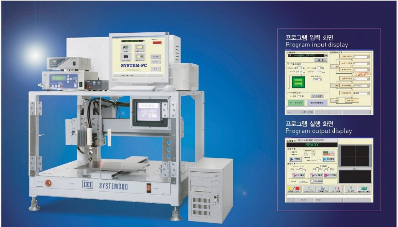
프로그램 입력 화면 Program input display

고강성고정도 탁상형화상인식 기능 탑재 도포 장치 Automatic dispensing unit with advanced vision system